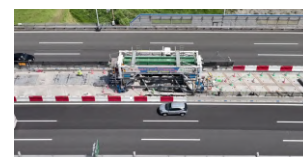
移動床版架設機を用いた現況車線確保による施工(イメージ)