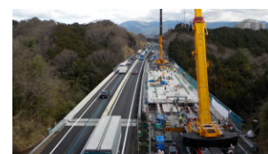
大型クレーンによる全断面施工(従来)